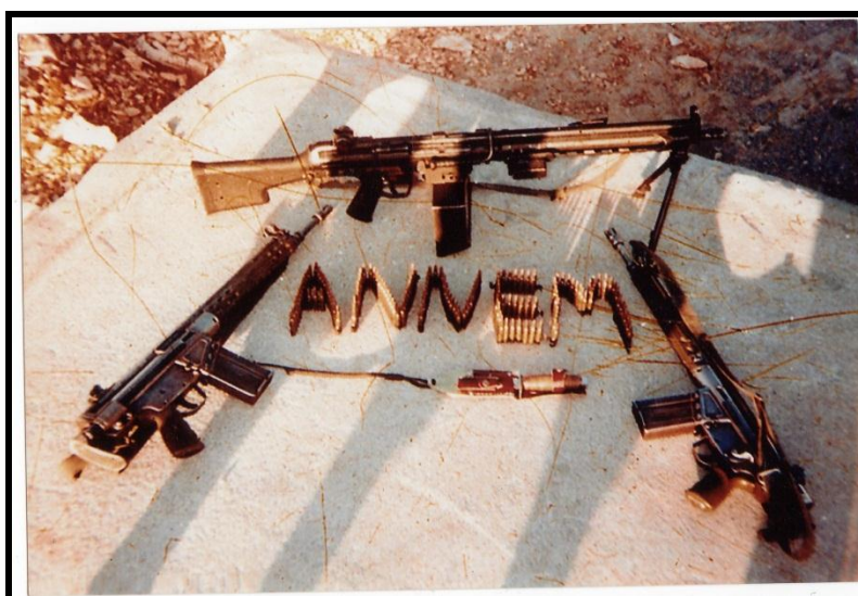
(Photographie mise en vente au marché des commandos, « Ma Maman », 2007)

Le culte des martyrs et des vétérans et la production discursive d'une représentation déshumanisée de l'ennemi favorisent le processus d'armement moral contre les guérilleros du PKK. La construction sociale de la guerre et la désignation d'« ennemis de l'intérieur » sont bien à l'œuvre. Le culte du martyr et du vétéran renforce une identité nationale conforme à l'idéologie kémaliste de l'État turc et stigmatise la figure de l'ennemi de la nation. La population turque est sans cesse sollicitée, directement ou indirectement, dans ce conflit. Par exemple, la mort d'un soldat affecte toute la société. Il pourrait être le fils de n'importe qui. Chacun se sent concerné et tout le monde connaît un proche qui a été envoyé dans les zones majoritairement kurdes lors de son service. L'implication des appelés et de leurs proches à ce conflit participe également à la diffusion et à l'intériorisation d'un mode de pensée sécuritaire. L'institution militaire en retire donc une certaine légitimité sociale. Au marché des commandos de Kayseri où se rendent les appelés qui effectuent leurs classes, n'importe qui peut acquérir des cartes postales mettant en scène des caricatures illustrant la vie à la caserne, où des grenades qui semblent être des vraies sont disposées de manière à ce que nous puissions lire « Je t'aime » ou « Je ne suis pas encore mort maman ».