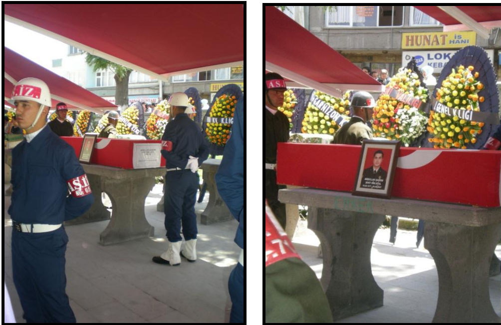
Cérémonie funéraire de martyr, Kayseri, 6 août 2007

L'ordonnancement institutionnel de l'évènement par les forces armées tente sans doute de canaliser la colère et les émotions des participants.