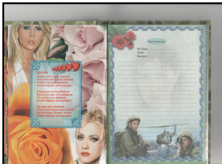
(Une page d'un cahier de souvenirs, prêt à être utilisé par les conscrits)

sont bien les femmes qui sont le plus mises en avant dans ces cahiers, pouvant devenir l'objet de fantasmes de la part des appelés, donc d'évasion mentale.